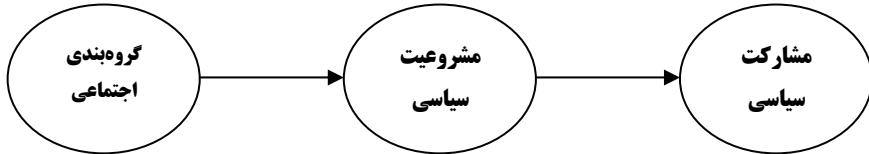
نمودار ۱- مدل نظری پژوهش

و براساس آن مدل تحقیق، به این صورت ترسیم شده است: