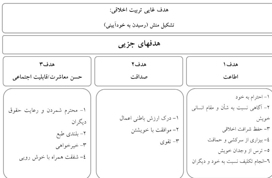
شکل (۱) اهداف تربیت اخلاقی و اجتماعی از دیدگاه کانت

به این ترتیب، هدفهای غایی و جزئی تربیت اخلاقی و اجتماعی از دیدگاه کانت را می‌توان در شکل (۱) نمایش داد: