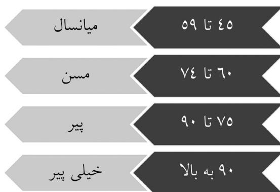
شکل (۱) تعریف سازمان بهداشت جهانی از سالمند

پدیده سالمندی سیر طبیعی است که در آن تغییرات فیزیولوژیکی و روانی ویژه‌ای در بدن رخ می‌دهد. جدی‌ترین خطری که فرد سالمند را تهدید می‌کند در انزوا قرار گرفتن او از سوی اطرافیانش است. آنچه بیش از همه حائز اهمیت است نحوه برخورد و نگرش نسبت به پدیده سالمندی است به همین جهت باید سالمندی را به‌عنوان یک امر طبیعی مطرح کرد و جامعه و خانواده و افراد را از طریق آموزش صحیح برای مواجهه با آن آماده کرد. به عبارتی سطح فرهنگ جامعه را در این رابطه ارتقا بخشید.