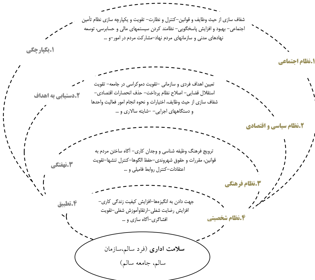
شکل (۲) مدل پیشگیری از فساد اداری با الهام از نظریه کارکردگرایی پارسونز در سیستمهای اجتماعی