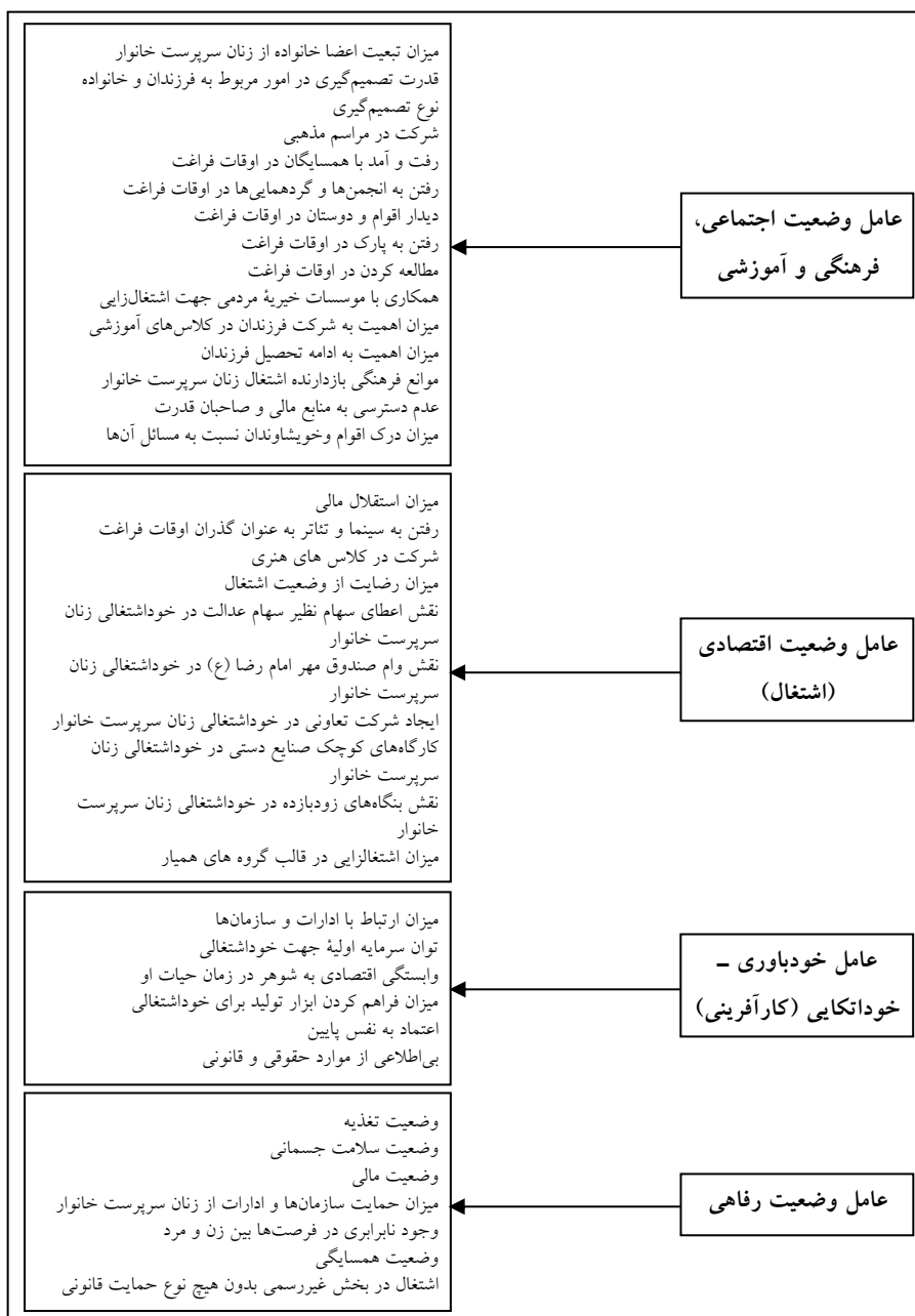
شکل ۲: مدل تجربی عوامل و مولفه‌های موثر بر وضعیت زنان سرپرست خانوار