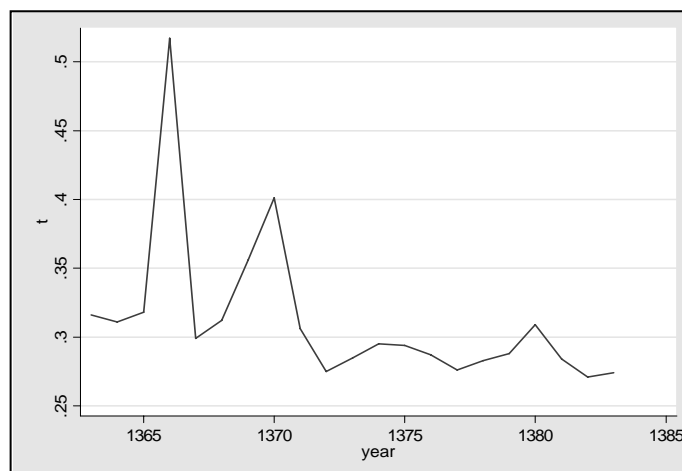
نمودار ۲: روند نابرابری در مناطق شهری با استفاده از شاخص تایل

در نمودار شماره ۳ روند نابرابری طی سال‌های ۸۳-۱۳۶۳ در مناطق شهری خلاصه شده است. در سال‌های ۶۵، ۷۰، ۶۶ به ترتیب بیشترین سطح نابرابری و در سال‌های ۸۳ و ۸۲ به ترتیب کمترین سطح‌های نابرابری دیده شده است. نتایج حاصل از برآورد شاخص آتکینسن طی سال‌های ۸۲-۱۳۶۳ در مناطق روستایی با استفاده از \epsilon (۱/۰، ۲/۰، ۳/۰، ۴/۰، ۵/۰، ۶/۰، ۷/۰، ۸/۰، ۹/۰، ۱۰/۰) در جدول شماره ۲ خلاصه شده است. در 0 < \epsilon < 1 در روند نابرابری (مناطق روستایی) طی سال‌های ۸۲-۱۳۶۳ سازگاری وجود دارد. هرچه مقدار \epsilon بیشتر می‌شود مانند مناطق شهری، این سازگاری کمتر می‌گردد و روند نابرابری در \epsilon های بالاتر با هم متفاوت است. در جدول شماره ۲ نتایج حاصل از برآورد شاخص تایل و ضریب جینی در مناطق روستایی طی سال‌های ۸۲-۱۳۶۳ خلاصه شده است.