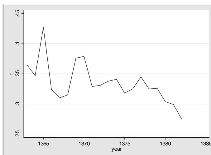
نمودار ۵: روند نابرابری در مناطق روستایی با استفاده از شاخص تایل

در نمودار شماره ۵ روند نابرابری طی سال‌های ۸۲ - ۱۳۶۳ در مناطق روستایی با استفاده از شاخص تایل خلاصه شده است. در سال‌های ۶۹، ۷۰، ۶۵ به ترتیب بیشترین سطح نابرابری و در سال‌های ۸۲ و ۸۱ کمترین سطح نابرابری دیده می‌شود. در نمودار شماره ۶ روند نابرابری طی سال‌های ۸۲-۱۳۶۳ در مناطق روستایی آورده شده است. در سال‌های ۷۷، ۶۹، ۷۰ بیشترین سطح نابرابری و در سال‌های ۶۸ و ۶۶ کمترین سطح نابرابری دیده شده است.