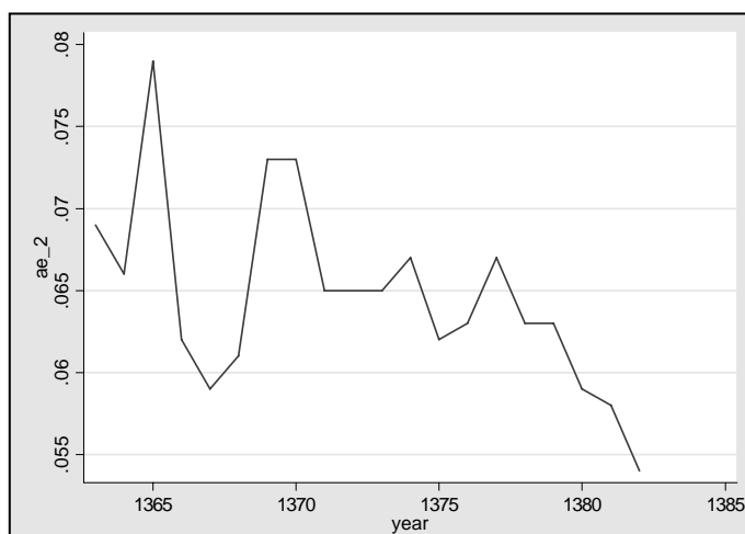
نمودار ۴: روند نابرابری در مناطق روستایی با استفاده از شاخص آتکینسن

در نمودار شماره ۴ روند نابرابری با استفاده از شاخص آتکینسن در دامنه معنی‌دار نشان داده شده است. در این نمودار بیشترین سطح نابرابری طی دوره ۸۳-۱۳۶۳ در سال‌های ۷۰، ۶۹، ۶۵ و کمترین سطح نابرابری در سال‌های ۸۲، ۸۱ دیده شده است