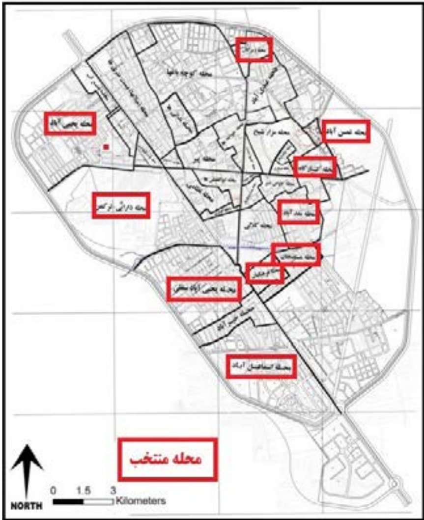
شکل (۳) محلات مورد مطالعه در شهر تربت جام