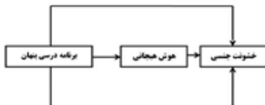
شکل ۱. مدل نظری پژوهش

بر اساس مدل نظری، فرضیه اصلی تحقیق عبارت است از: بین برنامه درسی پنهان و خشونت جنسی دانشجویان زن متأهل شهرستان گرگان با توجه به نقش میانجی هوش هیجانی رابطه وجود دارد.