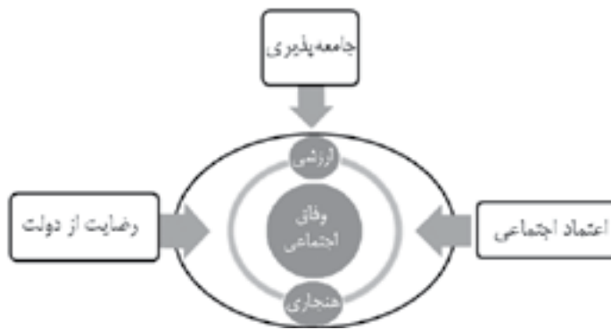
شکل (۱) مدل نظری وفاق اجتماعی

لذا بر اساس ابعاد مطرح‌شده پیرامون وفاق و همچنین متغیرهای تأثیرگذار بر آن، چهارچوب نظری تحقیق در قالب مدل زیر (شکل ۱) خلاصه می‌شود.