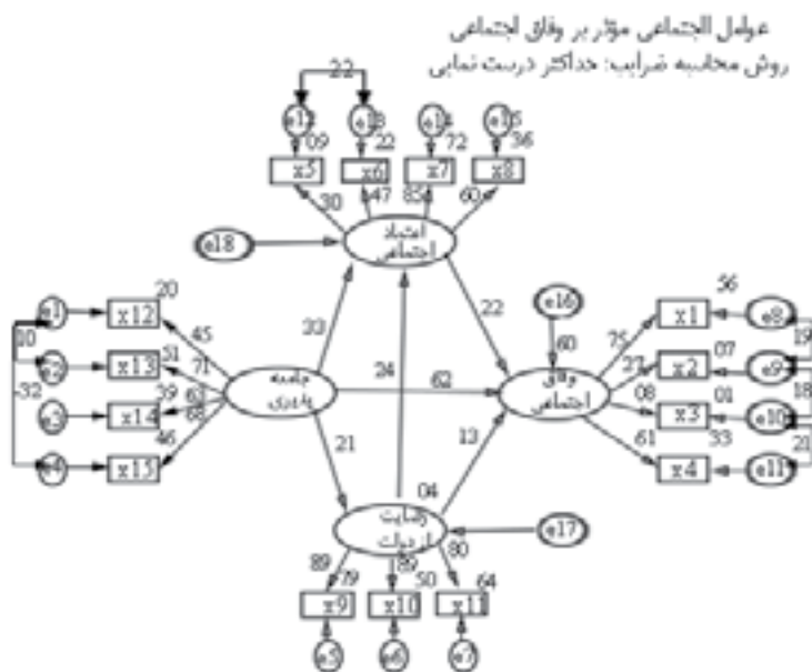
شکل (۲) مدل معادلات ساختاری در حالت تخمین استاندارد

کای اسکوئر بهنجار و نسبی ( \chi^2/df ): یکی از شاخصهای عمومی برای به حساب آوردن پارامترهای آزاد در محاسبه شاخص برازش، کای اسکوئر بهنجار یا نسبی است. اغلب اندیشمندان مقادیر بین ۲ تا ۳ را برای این شاخص قابل قبول می‌دانند. شاخص برازش تطبیقی (cfi): مقدار یکسانی برای قابل قبول بودن مدل برای این شاخص ذکر نشده است اما مقدار ۹/۰ به بالا قابل توافق است.