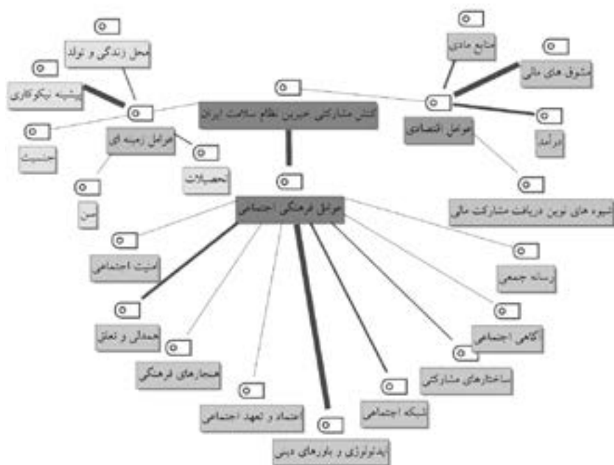
شکل (۲) مدل تبیین جامعه‌شناختی عوامل مؤثر بر کنش مشارکتی خیرین نظام سلامت