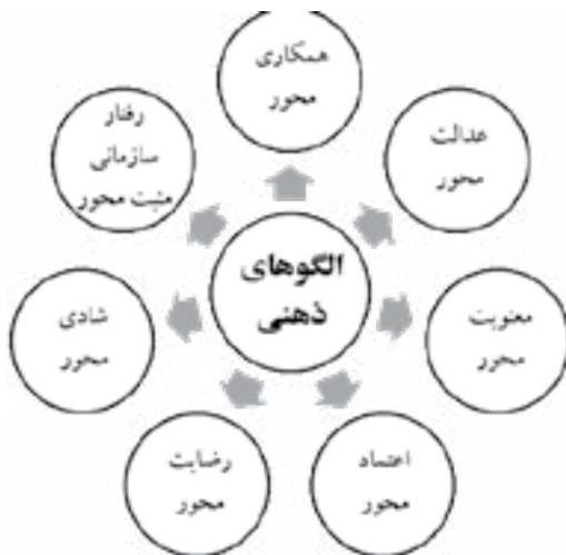
شکل (۳) الگوهای ذهنی مدیران در راستای بهزیستی ذهنی کارکنان

بنابراین، با هدف مطالعه کیو و معیار تفسیرپذیر بودن عاملها یا گروهها، هفت دسته‌بندی از ذهنیت و عقاید مشارکت‌کنندگان به دست آمد. هفت الگوی ذهنی مدیران و سرپرستان مجتمع فولاد گیلان برای بهزیستی ذهنی کارکنان خود عبارتند از: عدالت محور، همکاری محور، معنویت محور، اعتماد محور، رضایت محور، شادی محور، رفتار سازمانی مثبت محور.