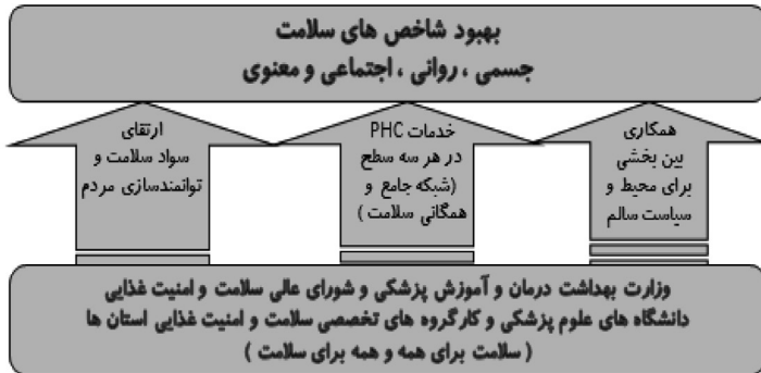
شکل (۲) راهبردهای کلان تحول حوزه بهداشت کشور