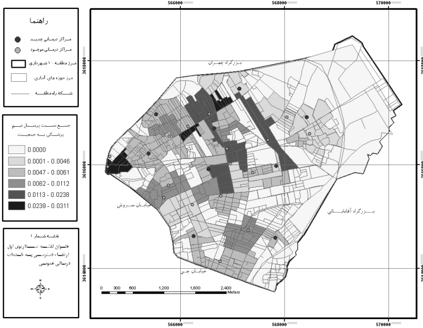
نقشه شماره ۱ (سناریوی اول)