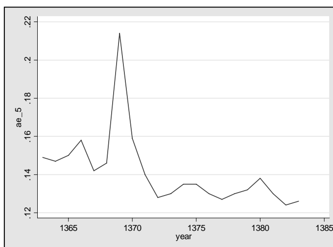
نمودار ۱: روند نابرابری در مناطق شهری با استفاده از شاخص آتکینسن

در نمودار شماره ۲ روند نابرابری طی سال‌های ۸۳-۱۳۶۳ در مناطق شهری خلاصه شده است. در سال‌های ۶۹، ۷۰، ۶۶ به ترتیب بیشترین سطح نابرابری دیده می‌شود و در سال‌های ۸۲، ۸۳ به ترتیب کمترین سطح نابرابری وجود دارد.